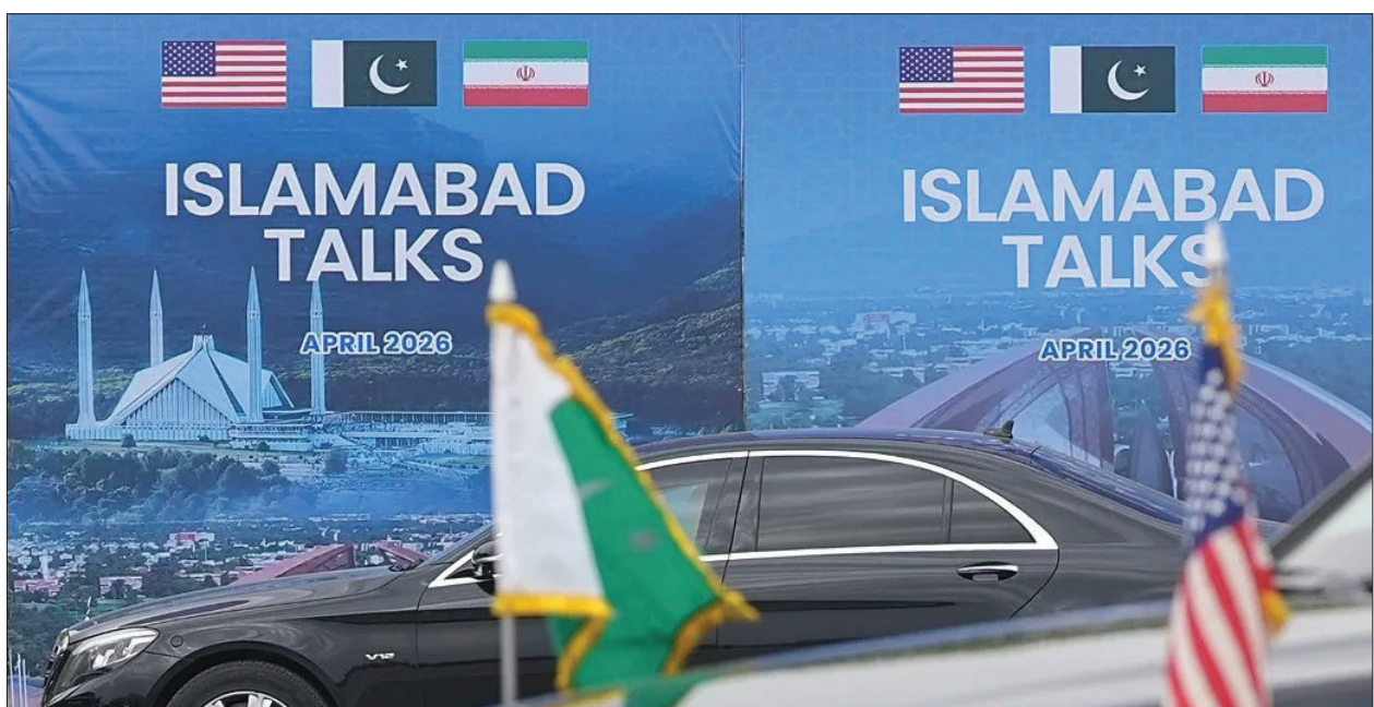
باكستان تؤكد مواصلة الجهود المكثفة لحل القضايا العالقة بين الطرفين

من جانبه، تلقى الشيخ جراح جابر الأحمد الصباح وزير الخارجية الكويتي اتصالاً هاتفياً من نظيره الهندي سوبراهمانيام جايشانكار، وتناول الاتصال تطورات الأحداث الراهنة في المنطقة والجهود المبذولة لمعالجتها. أما في بيروت، فقد أجرى يوسف رجي وزير الخارجية اللبناني اتصالاً هاتفياً مع نظيره الألماني يوهان فاديفول، استعرضا خلاله التطورات المتسارعة في لبنان على خلفية المفاوضات المرتقبة مع الكيان الإسرائيلي في واشنطن. وأوضح الوزير اللبناني أن بلاده تسعى من خلال مفاوضات مباشرة مع الجانب الإسرائيلي إلى التوصل لوقف إطلاق نار دائم وشامل، ومن جهته أعرب الوزير الألماني عن دعم بلاده الراسخ لجهود الحكومة اللبنانية في بسط سيادتها وتحقيق الاستقرار، مؤكداً أن ألمانيا تعمل بكل السبل للمساهمة في الوصول إلى وقف لإطلاق النار في لبنان.