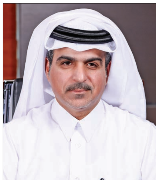
• الدوحة - العربي

أعلنت شركة الإجارة القابضة عن تحقيق أداء مستقر خلال الربع الأول من عام 2026، حيث سجلت نمواً في صافي الأرباح بنسبة 1%، مدعوماً بجهود تحسين الكفاءة التشغيلية وترشيد التكاليف، إلى جانب استقرار أداء القطاعات الرئيسية، وعلى رأسها نشاط تأجير العقارات الذي واصل تحقيق نتائج إيجابية على صعيد الإيرادات والأرباح، على الرغم من التحديات التي تشهدها المنطقة.