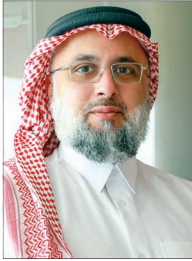
○ الشيخ د. أحمد بن محمد بن غانم آل ثاني

● تنظيم 2 جوائز وافية علمية (محلية وعالمية) باسم الشيخ علي بن عبدالله آل ثاني الوافية، عدد البحوث المشاركة في الجائزة الدولية بعدد (51) بحثاً، وعدد البحوث المشاركة في الجائزة المحلية بعدد (6) أبحاث. ● رصد الأهلة وإعداد تقارير إثبات دخول الشهر الهجري عدد مرات الرصد (12) مرة. ● ويعكس نحو الحراك العلمي توجه الوزارة نحو تحويل البحث الشرعي إلى أداة فاعلة.