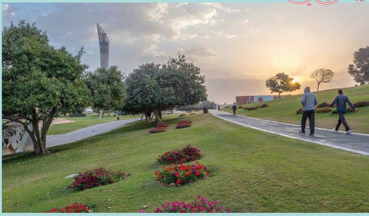
○ حديقة أسباير.. جمال الطبيعة ونقاء الهواء