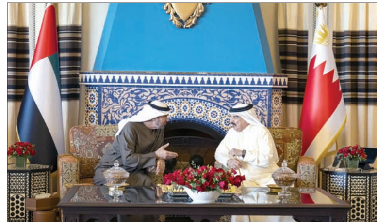
ملك البحرين ورئيس الإمارات يبحثان مستجدات المنطقة وتداعياتها

وفي تطور يعكس التنسيق الوثيق بين إسلام آباد وبكين، شدد وزير الخارجية الصيني وانغ يي على أن الحفاظ على الهدنة في الشرق الأوسط يمثل «الأولوية القصوى». وجاء ذلك خلال اتصال هاتفياً أجراه وانغ مع نظيره الباكستاني إسحق دار، حيث أكد البيان الصيني أن «الأولوية القصوى هي لبذل كل ما في وسعنا لمنع استئناف الأعمال العدائية والحفاظ على مسار وقف إطلاق النار الذي تحققت بصعوبة كبيرة».