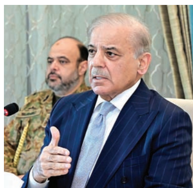
شهباز شريف يؤكد أن الهدنة لا تزال صامدة

وتعكس هذه التصريحات المتزامنة من باكستان والصين وروسيا وتركيا حالة من التنسيق الدبلوماسي الدولي لدعم الهدنة، وتركز الجهود الحالية على منع أي تصعيد عسكري جديد، مع الاستعداد لجولات مفاوضات مقبلة قد تشمل ضمانات أمنية واقتصادية للطرفين.