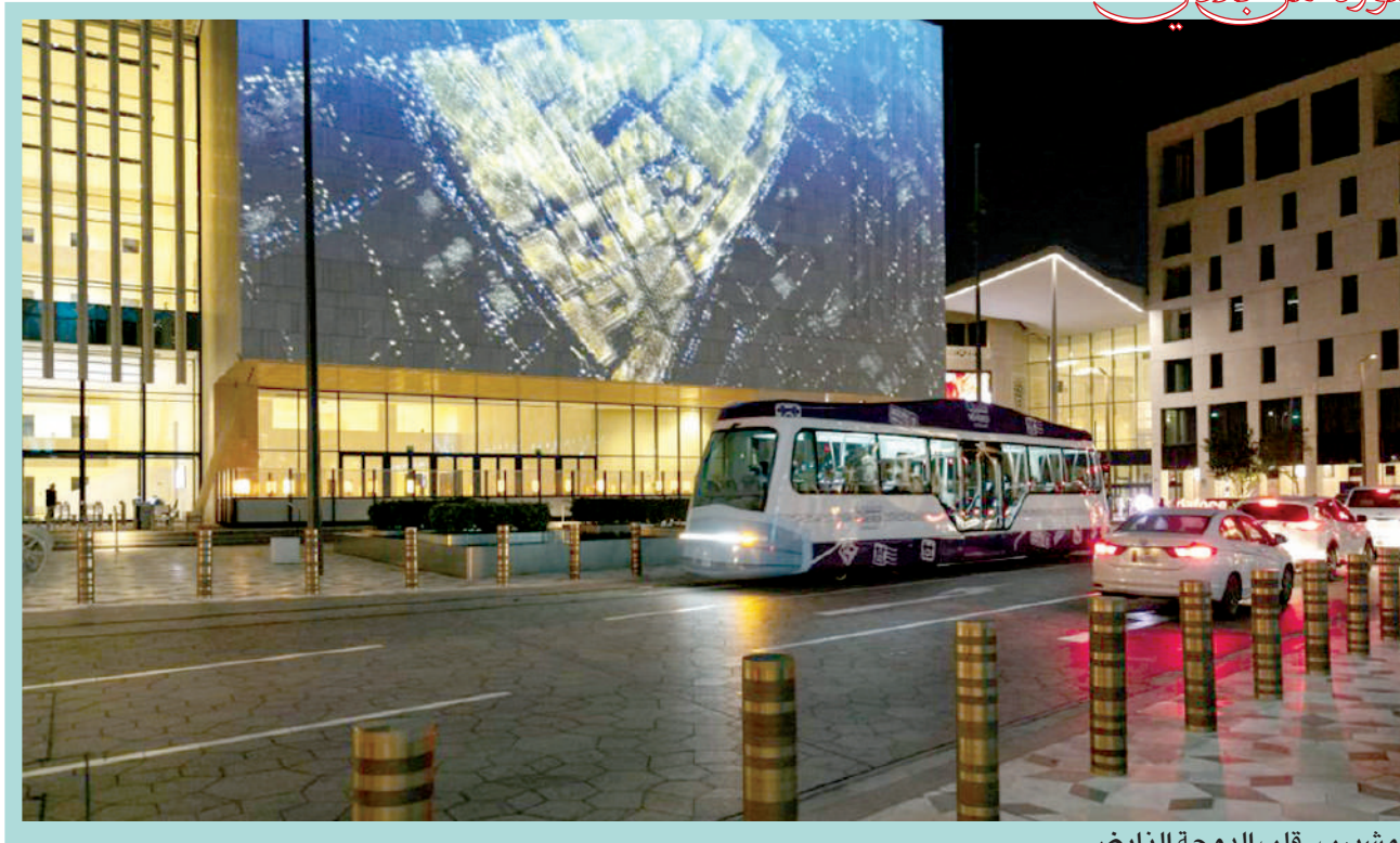
مشيرب.. قلب الدوحة النابض