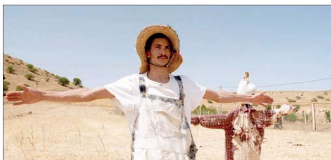
● الدوحة - العرب

في إطار فعاليات العام الثقافي قطر - المغرب 2024، يعرض مهرجان أجيال السينمائي 2024، الذي تنظمه مؤسسة الدوحة للأفلام، في الفترة من 16-23 نوفمبر الجاري، مجموعة مختارة من الأفلام المغربية القصيرة المعاصرة التي تعكس جمال المشهد الثقافي المغربي المتنوع والنسيج الاجتماعي المتطور.