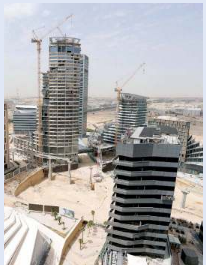
تباطؤ أداء سوق العقار السعودي

قال موقع «الجزيرة» الإخباري، إن مؤشرات قطاع العقار في المملكة العربية السعودية تشهد تراجعاً، وفقاً للمعطيات الاقتصادية، وذلك وسط توقعات بانخفاض أسعار العقارات العام المقبل في بعض المناطق إلى نحو النصف. ففي العاصمة الرياض، انخفضت نسبة الإيجارات ومبيعات المساكن بنسبة 3% على أساس سنوي. وفي جدة الواقعة غربي المملكة، انخفضت صفقات إيجارات المكاتب بالربع الثاني من هذا العام بنسبة 9%. ويعاني السوق العقاري السعودي من مشاكل عديدة،