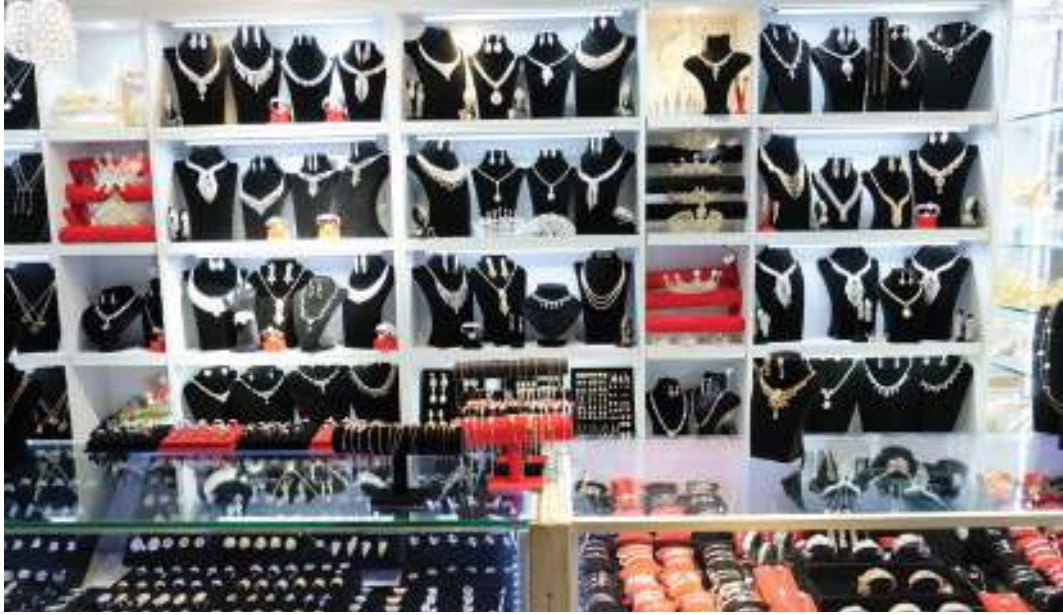
الأعياد تنعش مبيعات محلات الإكسسوارات

قال عدد من باعة الملابس، في الأسواق المحلية، إن المبيعات تضاعفت خلال الثلث الثالث من أغسطس الماضي، وذلك مقارنة بالثلث الأول من الشهر ذاته، إضافة إلى نمو مستوى الإقبال على المحلات التجارية.