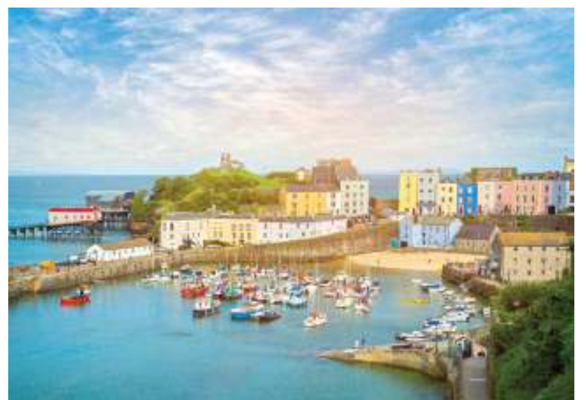
كارديف عاصمة ويلز، أحدث وجهات الخطوط القطرية

أعلنت الخطوط الجوية القطرية، أمس، عن إطلاق رحلات يومية مباشرة إلى كارديف ابتداءً من 1 مايو 2018، وبذلك تعدّ الناقلة الحائزة على عدة جوائز أول شركة طيران في منطقة الخليج تسير رحلاتها المباشرة إلى ويلز وجنوب غرب المملكة المتحدة. وتعدّ كارديف وجهة استراتيجية مهمة للخطوط الجوية القطرية كونها تضيف جزءاً جديداً من المملكة المتحدة إلى شبكة وجهاتها المتنامية، فضلاً عن السماح للمزيد من السياح بفرصة زيارة