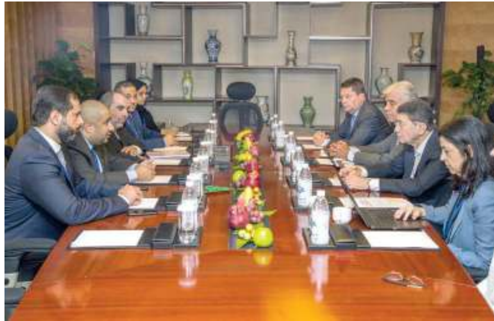
خلال اجتماع الرفاعي مع وفد الهيئة العامة للسياحة

اجتمع سعادة الدكتور طالب الرفاعي، الأمين العام لمنظمة السياحة العالمية التابعة للأمم المتحدة، مع السيد حسن إبراهيم، رئيس قطاع تنمية السياحة في الهيئة العامة للسياحة؛ وذلك على هامش الدورة الثانية والعشرين للجمعية العامة لمنظمة السياحة العالمية، والتي عُقدت في مدينة تشنجدو بالصين.