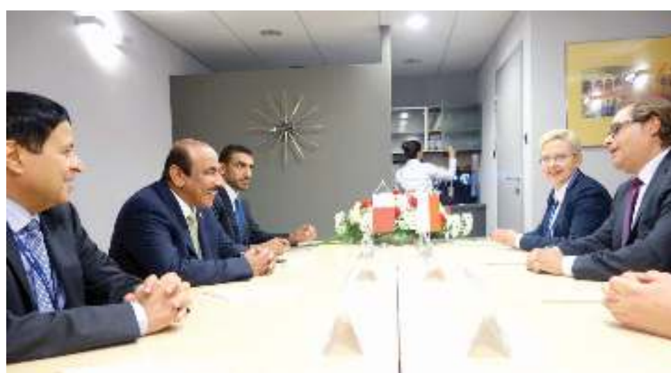
توطيد العلاقات مع وارسو

اجتمع سعادة السيد جاسم بن سيف السليطي وزير المواصلات والاتصالات، مع سعادة السيد مارك جروبارتجيك وزير الاقتصاد البحري والممرات المائية الداخلية في بولندا. وجرى خلال الاجتماع بحث أوجه التعاون بين البلدين الصديقين في مجال تبادل الخبرات، فيما يخص قطاع النقل البحري وتدريب الموظفين بالخبرات الكافية للعمل بهذا القطاع، بالإضافة إلى فتح خطوط ملاحية مباشرة بين بولندا وقطر، وبحث الفرص الاستثمارية في مجال الموانئ، كما بحث الاجتماع أيضاً فرص ابتعاث الطلبة القطريين للأكاديمية البحرية في بولندا، والتعاون في مجال الشهادات الأهلية البحرية، فضلاً عن بحث توقيع اتفاقيات خاصة بالقطاع البحري بين البلدين الصديقين. حضر الاجتماع سعادة السيد أحمد بن سيف المعضدي سفير دولة قطر لدى جمهورية بولندا.