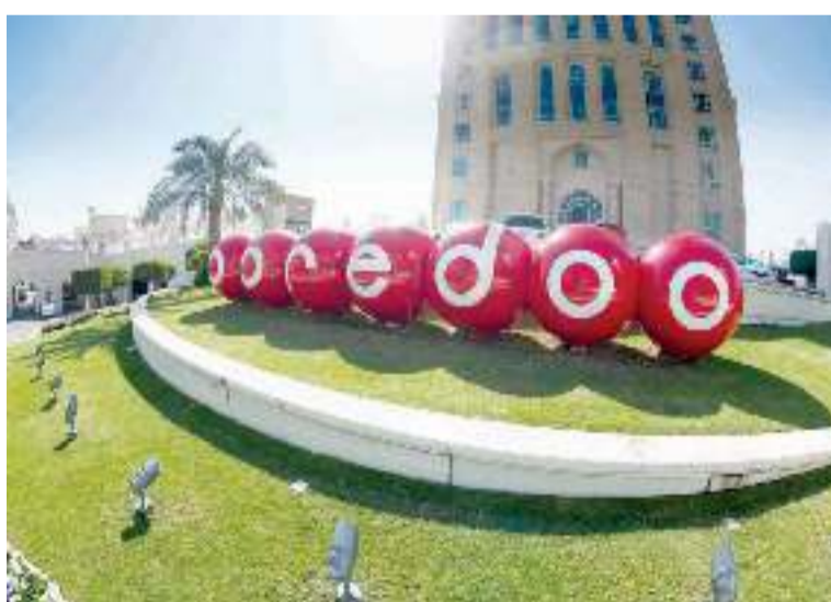
«ooredoo» داعمة لمختلف التطبيقات والمبادرات

وسيطبق الخصم بنسبة 20% (لا يتجاوز 15 روق) من قيمة الرحلة، بحيث يتم اقتطاعه من قيمة الفاتورة الإجمالية للعملاء مع نهاية الرحلة. ومع هذا الخصم المميز، سيحصل عملاء باقة الشهري سمارت 55 على قسيمة خصم واحدة شهرياً بقيمة 20%، بينما يحصل عملاء الشهري سمارت 100 على قسومتين، وعملاء الشهري سمارت 150 على 3 قسائم، وعملاء الشهري سمارت 250 وباقة قطرنا 350 على 4 قسائم، وعملاء الشهري سمارت 450، وباقة قطرنا