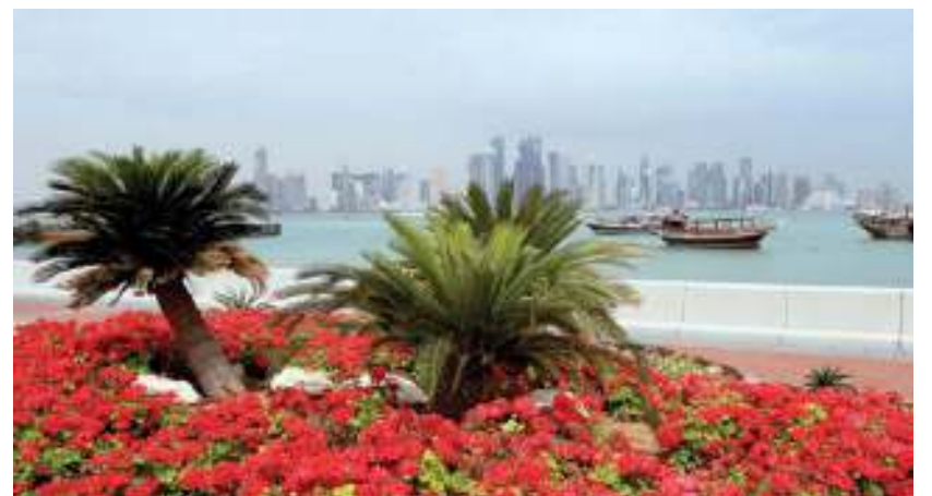
الدوحة، وجهة سياحية رابدية

وخلال الاجتماع، أطلع مسؤولون بالهيئة سعادة الدكتور الرفاعي على آخر التطورات في قطاع السياحة القطري، وكذلك على الاستعدادات الجارية لاستضافة الاحتفالات الرسمية بيوم السياحة العالمي التي تستضيفها الدوحة في 27 سبتمبر الجاري. ووجه الرفاعي تهنئته للهيئة لحصولها على صفة الوجهة السياحية المعتمدة من قبل الإدارة الوطنية للسياحة في الصين. وكانت قطر قد حصلت على هذه الصفة في مطلع هذا الأسبوع، مما يسمح لها باستقبال السياح من الصين والترويج للدوحة باعتبارها وجهة سياحية داخل