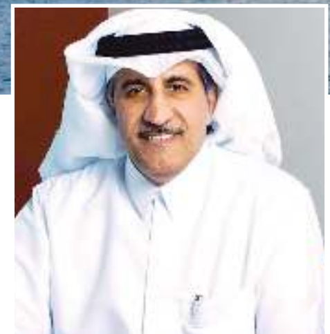
عبد الله بن محمد بن سعود

من أي بنوك. ويحوز الجهاز حصصاً في «كريدي سويس» و«باركليز»، وفي بنوك قطرية كبيرة. وفي الشهر الماضي، نُقل عن سعادة الشيخ عبدالله قوله «إنه لا توجد خطط لتصفية أصول أجنبية، كما كان يتكهن بعض المستثمرين. وإن الجهاز سيعمل قريباً عن استثمارات دولية كبيرة جديدة». ويتجاوز حجم أصول الجهاز مستوى 310 مليار دولار.