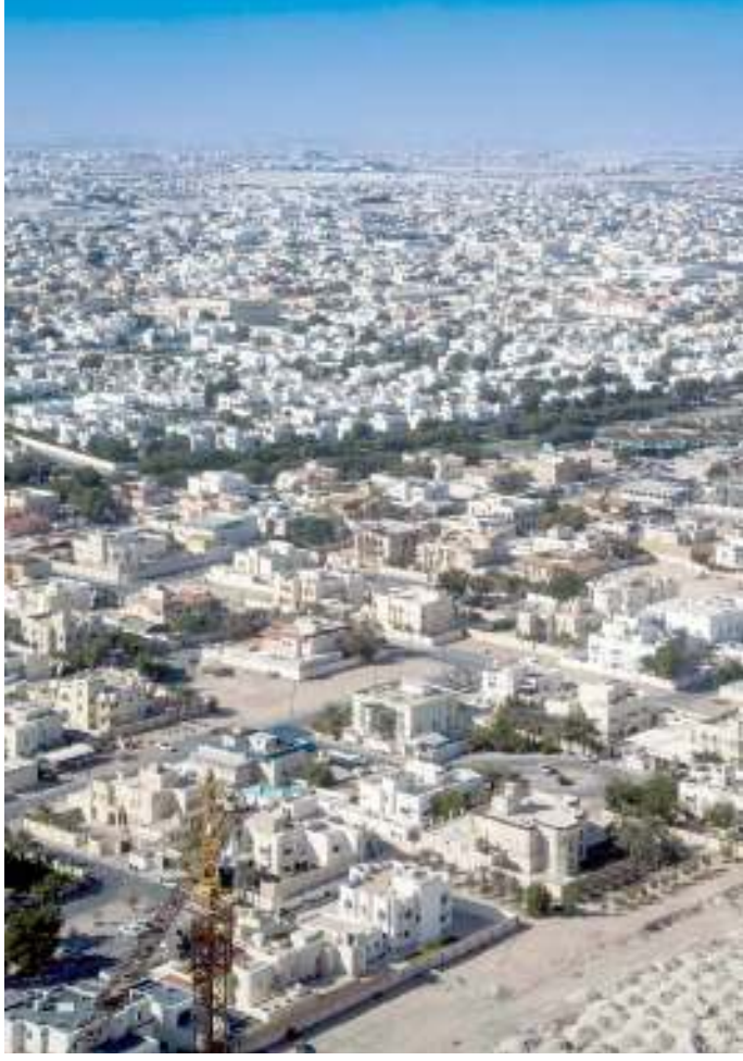
هدهد نسبي للتعاملات العقارية

ووفقاً لتقرير صادر أمس عن مجموعة «إزدان» القابضة، فقد شهد الأسبوع المشار إليه تداولات قيمتها 356 مليون ريال، نفذت عبر 56 صفقة، بانخفاض نسبته 13.8%، مقارنةً بسابقه. وأشار التقرير إلى استحواذ تعاملات الأراضي الفضاء على نسبة 35.4%، من إجمالي قيمة التعاملات العقارية، بقيمة بلغت نحو 126.2 مليون ريال، في حين واصلت المباني الجاهزة سيطرتها على تعاملات القطاع العقاري، حيث بلغت قيمة تعاملات العقارات الجاهزة نحو 229.8 مليون ريال، مستحوذة على نسبة 64.6% من مجمل التعاملات.