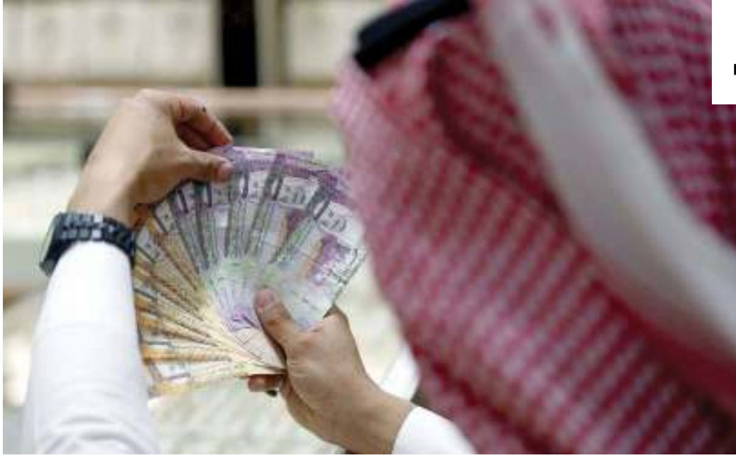
هل ستبقى منطقة الخليج ملاذاً استثمارياً مناسباً؟

ذكرت وكالة بلومبيرغ الأميركية أن الأزمة الخليجية التي قسمت منطقة الخليج، بطريقة تبدو دائمة، ستجبر المديرين التنفيذيين والمصرفيين والمستثمرين وصناع القرار السياسي الأجنبي على إعادة النظر في نهجهم تجاه الخليج. وترى الوكالة أن افتتاح دولة قطر لميناء حمد الدولي يوم 5 سبتمبر الجاري يرسل رسالة تحدُّ بأن قطر لن تكون حبيسة الحصار الذي تقوده السعودية، كما أن قطر تقدم الخيار لشركائها التجاريين، فيما أن يكونوا معها أو يكونوا ضدها.