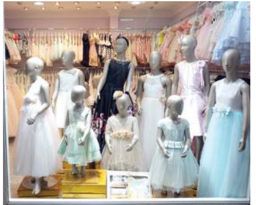
جميع البضائع من الصناعات التركية والكوبية والصينية