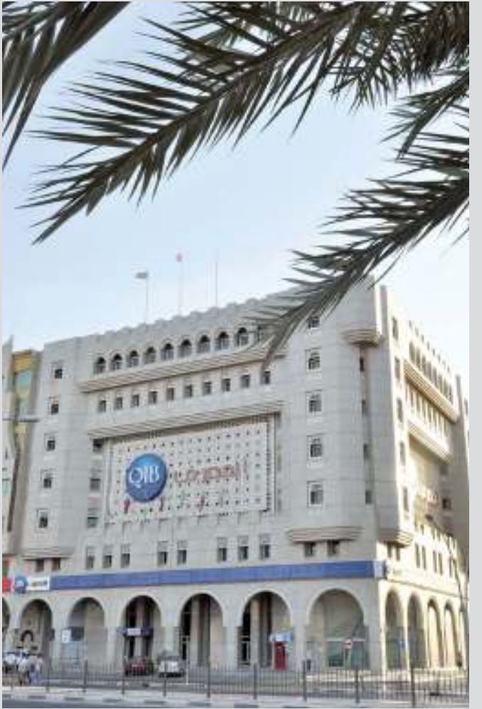
«المصرف» يواصل تقديم المزايا لعملائه

والمصممة خصيصاً لتلبية احتياجات السيدات؛ تقديراً لدورهن الكبير في المجتمع القطري. وأضاف د. أناند: «سنواصل تقديم منتجات وخدمات مصممة خصيصاً لتناسب عملائنا في أي مكان وأي وقت». يحصل العملاء الذين يحملون بطاقات «فيزا المصرف» على الخصومات بشكل تلقائي، لمزيد من المعلومات عن البطاقات أو برنامج الخصومات من «فيزا المصرف»، يرجى زيارة الموقع الإلكتروني الخاص بـ «المصرف». تسمح الصفحة الإلكترونية المخصصة للعملاء بعرض قائمة العروض بناء على البلد وفئة بطاقة فيزا الائتمانية الخاصة بـ «المصرف» التي يحملونها. كما يسهل استخدام الصفحة على الهواتف الذكية والأجهزة اللوحية.