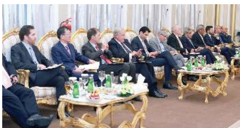
اهتمام كبير بتوقعات السادة حيال قطاع الطاقة وجوانب التنمية

بنسبة 40% فقط، والدليل على هذا التنوع في الاقتصاد هو الأرقام التي حققناها.