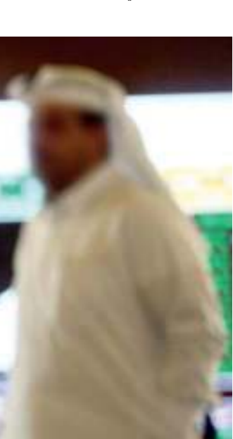
آمال بتحسن مسيرة البورصة

الخبراء والمستثمرون يؤكدون لـ «القب» أن البورصة ترتبط حالياً بأسباب خارجية، في مقدمتها العوامل السياسية والحصار الظالم المفروض على قطر منذ الخامس من يونيو، ويطالبون بطرح منتجات جديدة في السوق المالي أهمها الشركات