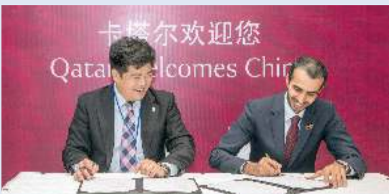
توقيع اتفاقية افتتاح المكتب التمثيلي

الفريصي: التسويق لقطر بالصين عبر حملة مجموعة مبادرات