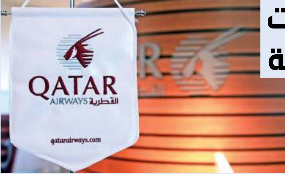
الناقلة تمضي قدماً في تعزيز مكائتها

دشنت الخطوط الجوية القطرية رحلاتها المباشرة إلى مدينة أضنة استجابة لطلب العملاء المتزايد على الرحلات إلى تركيا. وأصبحت المدينة الجنوبية «أضنة»، الوجهة الرابعة للناقلة الوطنية في تركيا. وستسير الوطنية لدولة قطر ثلاث رحلات أسبوعياً إلى أضنة، لتتضاف إلى وجهاتها الحالية، العاصمة أنقرة والمطارين الرئيسيين في مدينة اسطنبول.