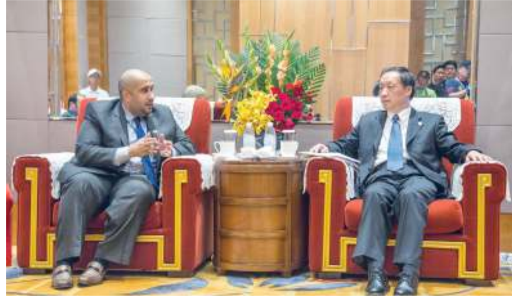
جانب من المحادثات الثنائية

وتسعى لاستقطاب الاستثمارات الكفيلة بتنميتها.