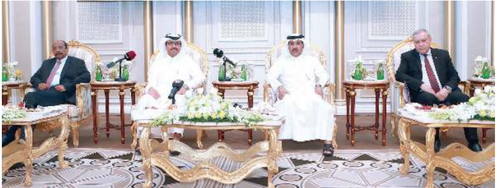
السادة تناول جميع الجوانب ذات الصلة بقطاع الطاقة

وبخصوص مستقبل أسواق النفط والغاز، أوضح السادة أن الشرق الأوسط به أكبر احتياطي من النفط والغاز، وستبقى هذه المنطقة هي المزود الرئيسي للنفط والغاز للعالم، مشيراً إلى أن دول الخليج مجتمعة تمثل ثلث الإنتاج العالمي من النفط وخمس احتياطي الغاز، وبالتالي فإن المنطقة ستبقى هي المحرك الرئيسي للطاقة والاقتصاد على مستوى العالم، كما تلعب دوراً مهماً في قطاعي الأمن والطاقة، مشيراً إلى وجود بعض التحديات، لافتاً إلى أن الوقود الأحفوري يحتل الكفاءة حتى يكون منافساً، وأن يلبي الطلب العالمي على الطاقة، لافتاً إلى وجود أنواع أخرى من الطاقة، لكن تحتاج وقتاً حتى يكون لها دور ملموس في سلة الطاقة العالمية، النفط والغاز والفحم الحجري ستبقى تمثل 75% من إجمالي الطاقة المستهلكة في العالم حتى عام 2040، مشيراً إلى أن النفط سيحافظ على رقم في استهلاك الطاقة، بينما خلال الفترة المقبلة حتى 2040، الذي سيحصل هو تزايد الطلب على الغاز، ففي حين يحتل الغاز حالياً رقم ثلاثة بعد الفحم الحجري، فإنه سيصبح رقم 2 مكان الفحم الحجري، لأن استهلاكه والطلب عليه في تزايد.