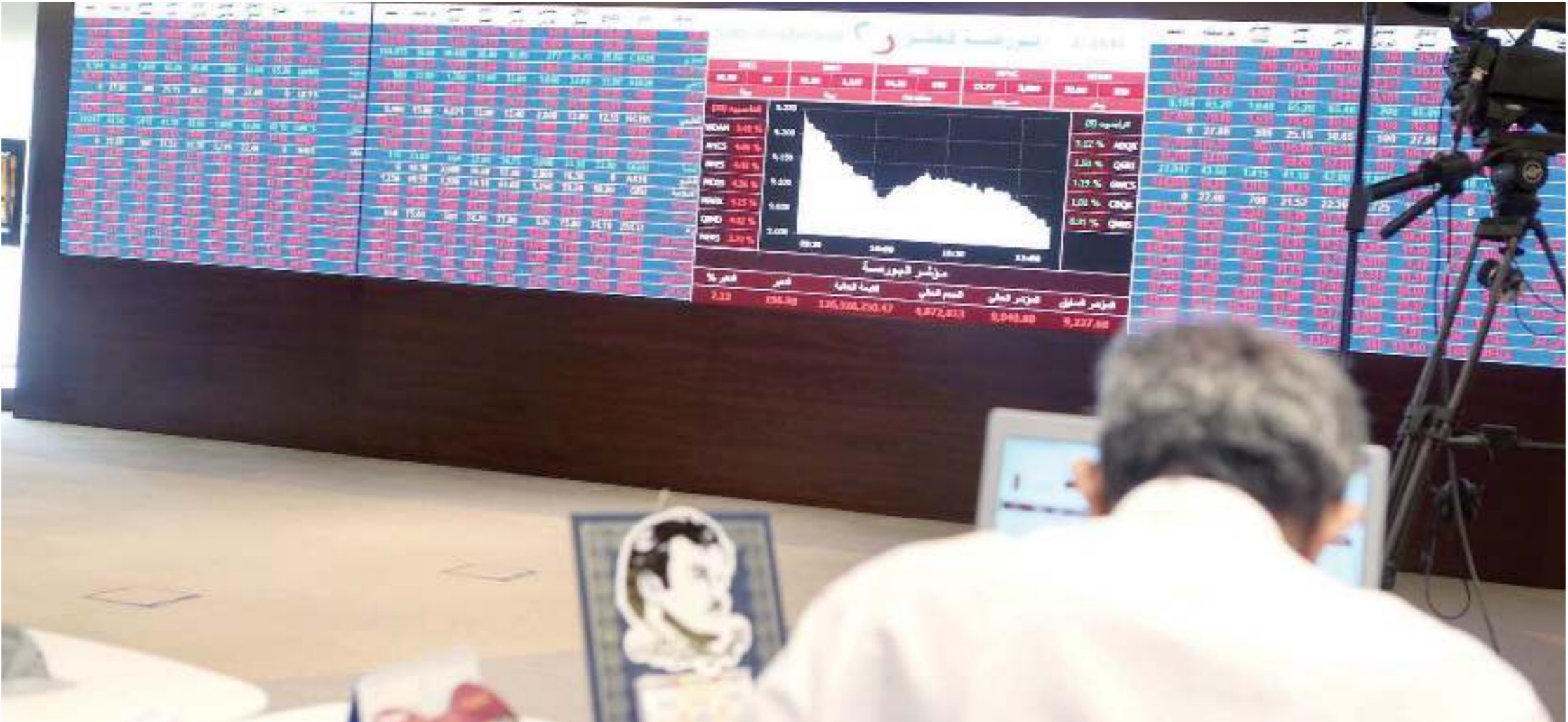
بورصة قطر تتراجع تراجعات غير مبررة

العدد 10685 | الأربعاء 22 ذو الحجة 1438هـ | 13 سبتمبر 2017م