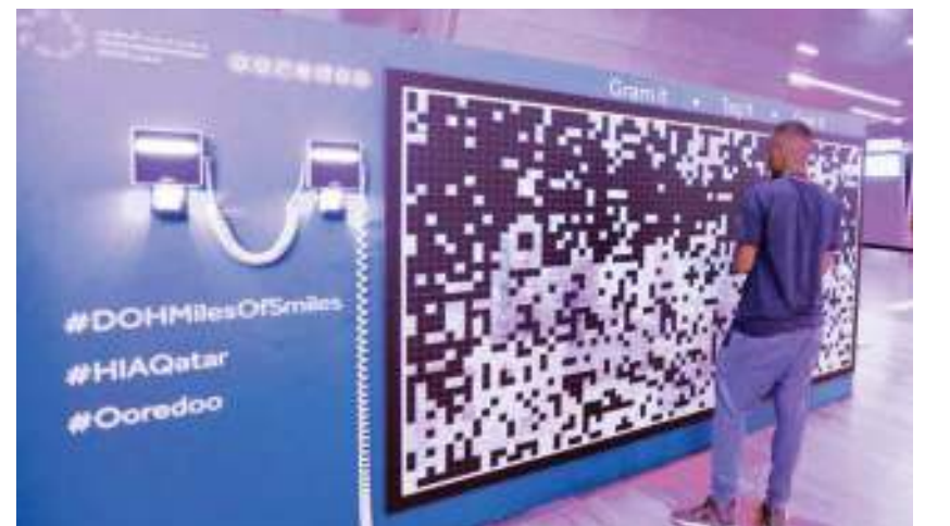
جانب من ركن صور العيد في مطار حمد الدولي

قدمت «ooredoo» ومطار حمد الدولي الشكر لآلاف المسافرين، الذين شاركوا في حملة ركن صور عيد الأضحى المبارك، التي