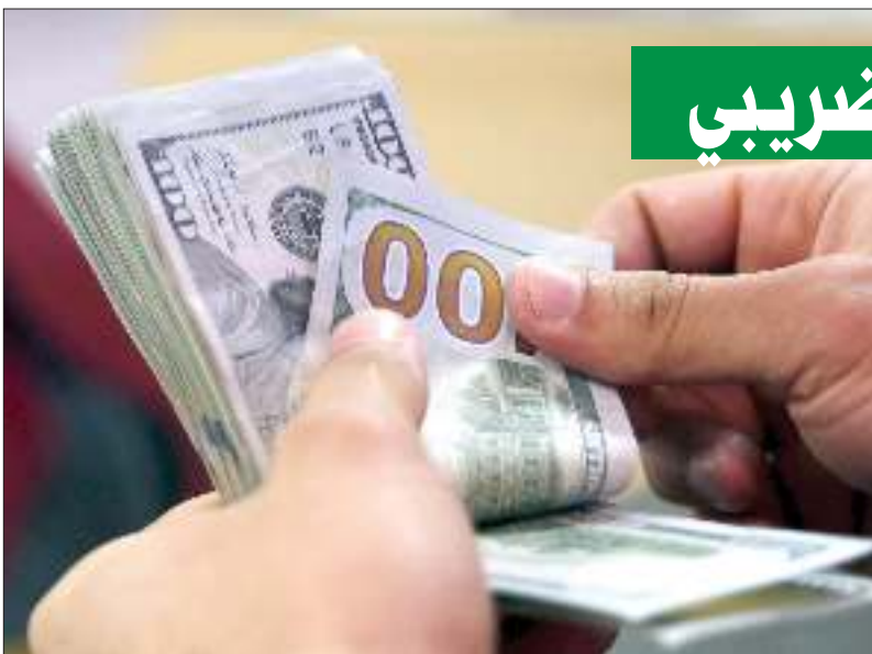
القائمة تشير إلى التهرب في الإمارات والبحرين

ولتحديد ما إذا كانت دولة «غير متعاونة»، يقيس مؤشر الاتحاد الأوروبي مدى شفافية نظامها الضريبي، ومعدلات الضرائب، وما إذا كان نظامها الضريبي يشجع الشركات المتعددة الجنسية تحويل الأرباح إلى أنظمة منخفضة الضرائب تقدم حوافز ضريبية مثل ضرائب قيمتها صفر % للشركات الأجنبية.