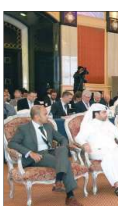
■ المؤتمر استقبل حضوراً واسعاً على مدار يومين

وعلى صعيد جميع المخرجات، فقد زادت ودائع العملاء لدى البنوك التجارية خلال نفس الفترة بأكثر من 17.5 ٪ مقارنة بعام 2016، وعلى صعيد التوظيف المحلي، فقد زادت التسهيلات الائتمانية المقدمة من البنوك التجارية لعملائها خلال نفس الفترة بنحو 13 ٪ مقارنة بمخيلتها الخاصة بعام 2016. وأشار إلى ارتفاع نسبة كفاية رأس المال لدى البنوك العاملة بدولة قطر في نهاية سبتمبر 2017م، لتصل إلى أكثر من 15.4 ٪ مقارنة بنحو 14.8 ٪ في نهاية سبتمبر 2016م، وبلغت نسبة القروض