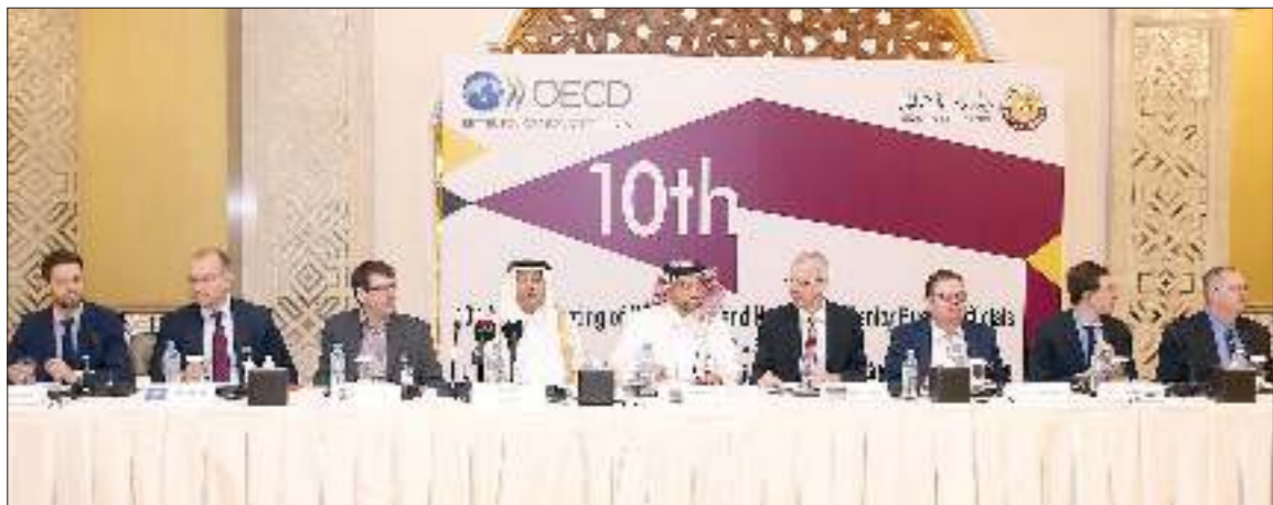
■ مناقشة مختلف الآراء والتصورات

الدوحة تستضيف اجتماع كبار مسؤولي الميزانيات العامة