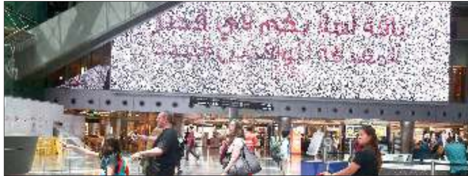
توفير سبل الراحة للمسافرين