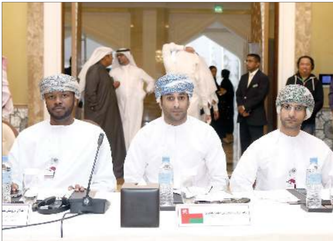
■ حضور واسع في الاجتماعات