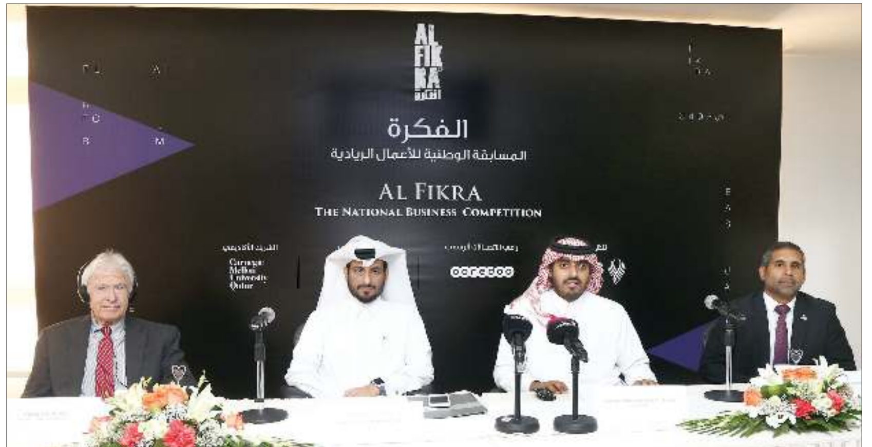
تعاون المؤسسات الوطنية لتحويل الأفكار لمشاريع

قال البروفيسور جورج وايت الأستاذ المتميز في مجال ريادة الأعمال في جامعة كارنيجي ميلون قطر: «نتشرف الجامعة أن ننضم إلى بنك قطر للتنمية في رعاية المسابقة السنوية الوطنية لريادة الأعمال - الفكرة. تمتلك جامعة كارنيجي ميلون تاريخاً طويلاً في تعزيز روح المبادرة في مقر الجامعة الرئيسي في بيتسبرغ، بنسلفانيا، الولايات المتحدة الأمريكية، وهنا في الدوحة، فنحن نعتقد أن ريادة الأعمال تعتبر من الأدوات الحيوية التي يمكن الاعتماد عليها في تحقيق رؤية قطر الوطنية 2030، وخلق اقتصاد قائم على المعرفة.