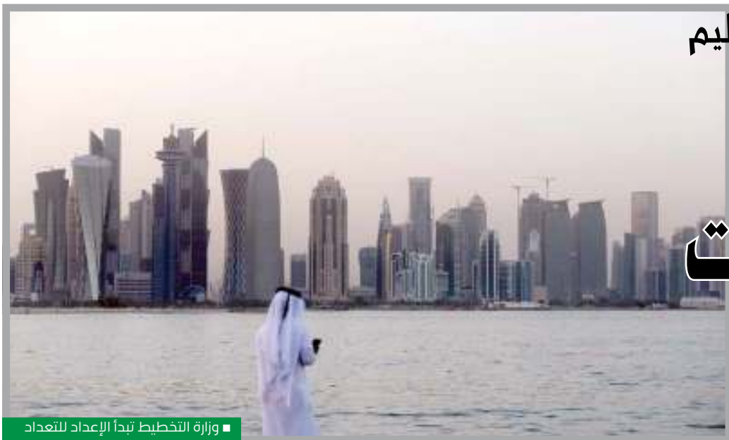
وزارة التخطيط تبدأ الإعداد للتعداد

أكدت وزارة التخطيط التنموي والإحصاء، أن التعداد العام للسكان والمساكن والمنشآت 2020، سيمثل نقلة نوعية في توفير البيانات بأقل جهد وتكلفة، وبشكل أكثر دقة وشمولية، وذلك من خلال الربط الآلي مع الجهات المصدرة للبيانات.