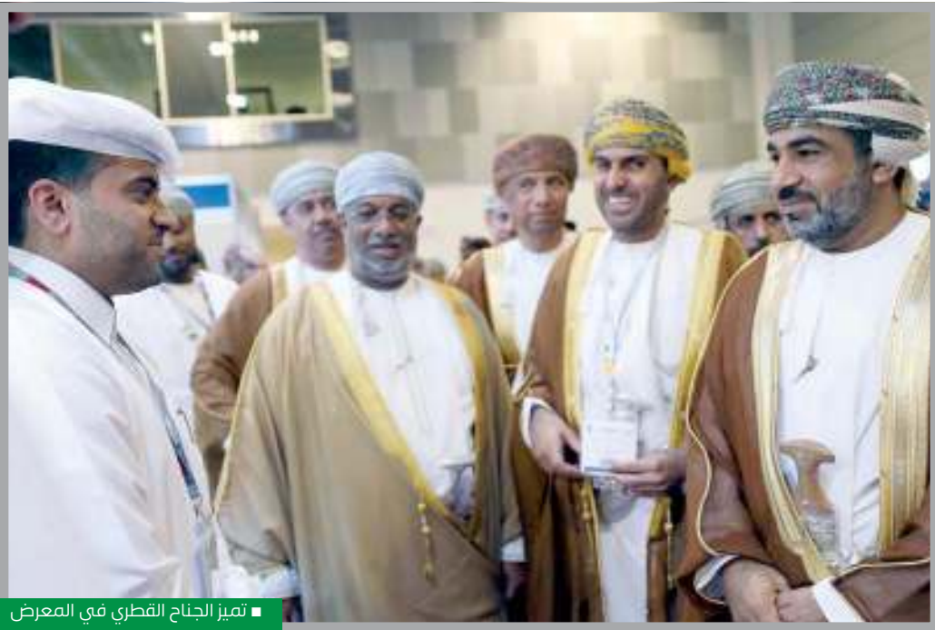
تميز جناح القطري في المعرض

يشارك مطار حمد الدولي بشكل فعال في ملتقى تبادل المطارات العالمية، من تنظيم مجلس المطارات الدولي، بوصفه راعياً ذهبياً. ويقام الملتقى في الفترة من 5 حتى 7 ديسمبر 2017 في مسقط، حيث يستقطب العديد من الجهات الرائدة في قطاع الطيران، من الشرق الأوسط وأوروبا وآسيا والمحيط الهادئ وباقي دول العالم، لتبادل الخبرات والمعرفة.