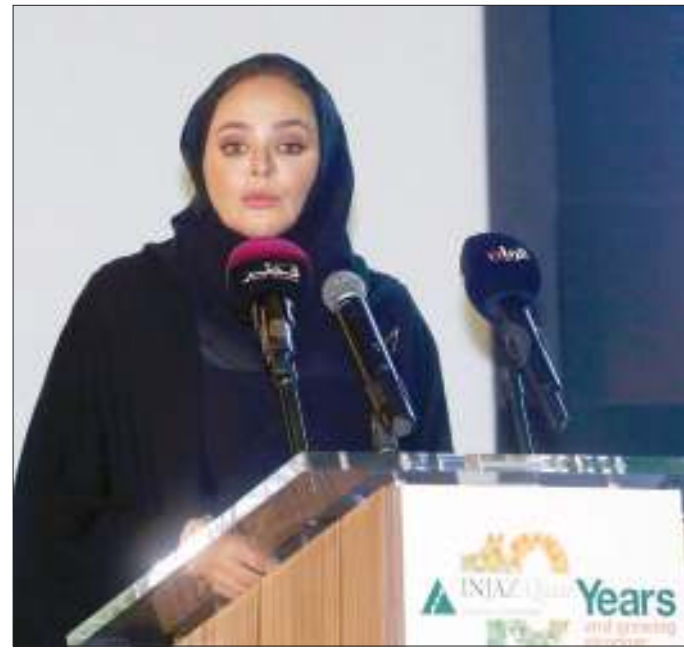
هنادي بنت ناصر

وأكدت الشبيخة هنادي على أن «إنجاز قطر» قدّمت برامج في المدارس الإعدادية والثانوية والجامعات ومراكز الشباب في جميع أنحاء الدولة، وذلك بمساعدة المجتمع التطوعي النشط، للوصول إلى الطلاب من الصف الثاني إلى المستوى الجامعي، مشيرة إلى أن المتطوعين من الشركات نماذج يُحتذى بها للشباب، ويشاركون