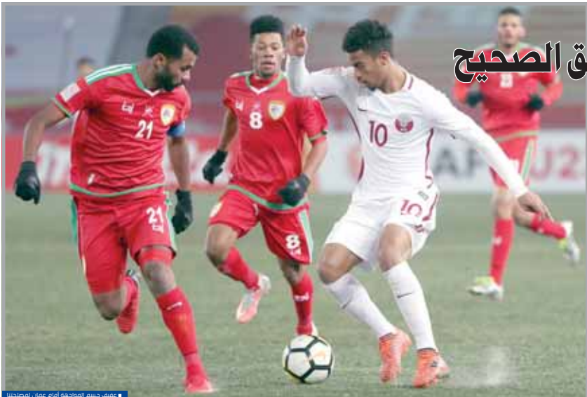
هدف حسم المباراة أمام عمان لمنتخبنا

وسط جماهيره، ومن هنا يتعين على منتخبنا مضاعفة الجهد والتعزيز بشكل كبير من أجل تحقيق هدفه بالصعود للربع الثاني ومع العماني يحتاج إلى تفعة واحدة من مباراته الأخيرة تلعب بعندين «القطر أو العراق» في ظل هذه الأوضاع الصعبة والدخول في الحسابات المعقدة وإلى جانب ذلك التأكيد على مبراه الصين مستحان على الجاهل الذي دخل المباراة أمام التنين والتي لا تكون سهلة على الإطلاق لا سيما أنه سواجها منتخباً عادياً يمتلك قومات كثيرة تساعده في تحقيق نتيجة إيجابية أبرزها خوض اللقاء على أرضه