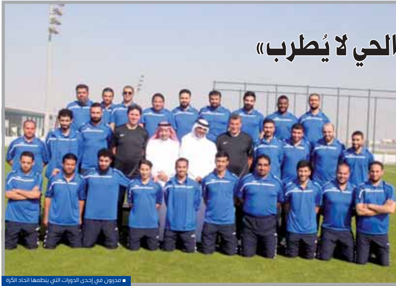
■ مصرون في إحدى الدورات التي ينظمها اتحاد الكرة