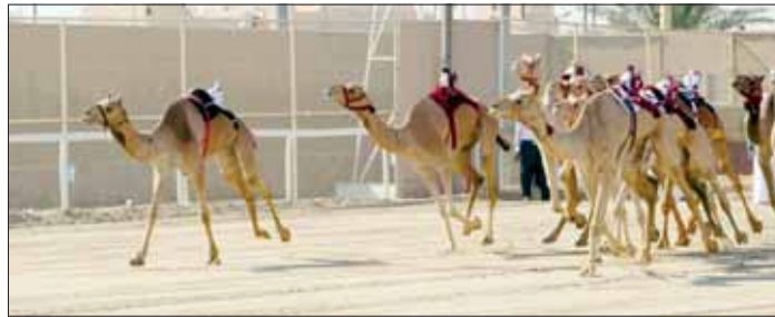
من منافسات السباق المحلي للهجن