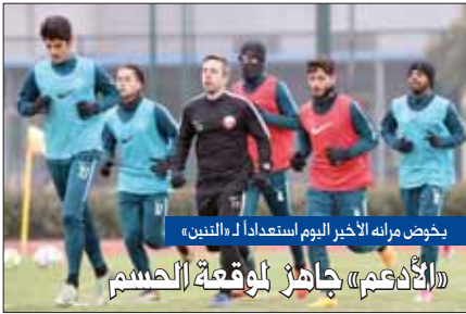
يخوض مرانه الأخير اليوم استعداداً لـ «التنين»

خاض المنتخب الأولمبي البياتي مره الأول أمام عقب الخسارة من نظيره الأوزبيكي بهدف دون رد، في الجولة الثانية بكأس آسيا تحت 23 عاماً، وذلك استعداداً للقاء، منتخبنا البرطاني غداً في الجولة الثالثة، وجاء الران بقيادة الإيطالي ماسيميليانو مالديني، وسط مشاركة جميع اللاعبين رقميون للصين على اللاعبين والجماهير الفني خلال الالآن الذي ركز فيه المدرب على تصحيح أخطاء اللاعبين، والتي كانت في البداية، كما ركز على التواحي القوية، وتدريباً على مستوى الهجوم، وهو ما يؤكد حرصه على تعميل القدرات الهجومية قبل مواجهة الأعداء، ويحتشد التنين تدريجياً لمباراة عمان، وسيضع المدرب من خلاله للنسات الأخيرة للقاء.