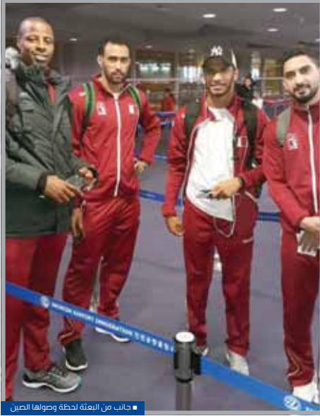
جانب من البعثة لحظة وصولها للصين

من العام المقبل بكل من الدنمارك والمانيا. وسيفتح المنتخب «الأدعم» مشاركته في البطولة الآسيوية أمام المنتخب النيوزيلندي في الثامن عشر من هذا الشهر، على أن يواجه الصين في المباراة الثانية، ثم يختم مشوار المرحلة الأولى بقاء السعودية.