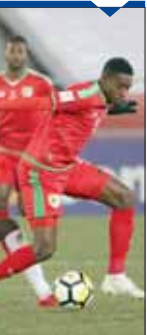
العمز في حالة دفاع

إلا أننا نطالب لاعبي المنتخب بضرورة التعاضد في هذه الميزة وأن يجتهدوا للفوز وحصد النقاط وتحقيق هدفه بالصعود للربع الثاني ومع العماني يحتاج إلى تفعة واحدة من مباراته الأخيرة تلعب بعندين «القطر أو العراق» في ظل هذه الأوضاع الصعبة والدخول في الحسابات المعقدة وإلى جانب ذلك التأكيد على مبراه الصين مستحان على الجاهل الذي دخل المباراة أمام التنين والتي لا تكون سهلة على الإطلاق لا سيما أنه سواجها منتخباً عادياً يمتلك قومات كثيرة تساعده في تحقيق نتيجة إيجابية أبرزها خوض اللقاء على أرضه