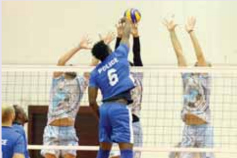
من لقاء والشرطة