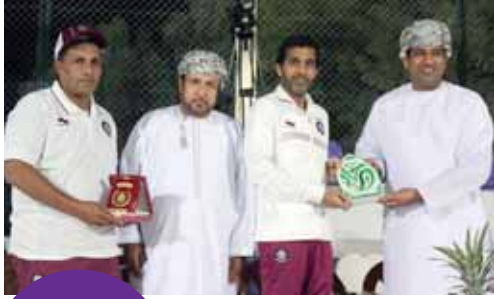
تبادل الهدايا التذكارية

التجربة أكدت جاهزية الاحتياط لكأس العالم