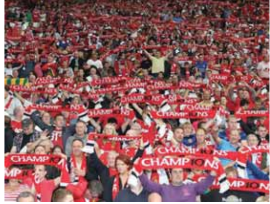
جماهير يونايتد مطالبة بمرشد من دعم فريقها أمام ليفربول

حدث جوزيه مورينيو مدرب مانشستر يونايتد الجماهير على التشجيع بقوة عند استضافة ليفربول في الدوري الإنجليزي الممتاز لكرة القدم يوم الأحد وأبلغهم «لا تأتوا فقط للمسرح» لكن «العبوا معنا». وتغلب يونايتد 2/صفر على هال سيتي باستناد أولد ترافورد في ذهاب قبل نهائي كأس رابطة الأندية الإنجليزية أمس الثلاثاء بفضل هدفين في الشوط الثاني عن طريق لاعبي الوسط خوان ماتا ورومان فيليني. لكن المدرب البرتغالي لم يكن سعيداً بالأجواء الهادئة في الشوط الأول والتي عكست الأداء الهائس من لاعبيه في الملعب. وأبلغ مورينيو وسائل إعلام بريطانيا «أعتقد أنه في الشوط الأول على اللاعبين أن يؤدوا بشكل أفضل. يجب أن أؤدي بشكل أفضل وعلى الجماهير