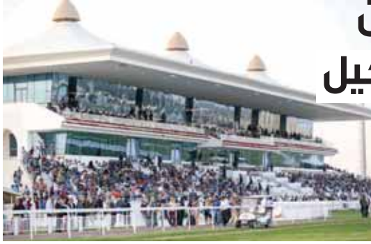
دماهير الفروسية على موعد مع الجوائز

برعاية سمو الشيخ عبدالله بن خليفة آل ثاني ينظم نادي السباق والفروسية اليوم واحدا من أقوى سباقات الموسم على كؤوس وجائزة سموه، وهو السباق 24 بنادي الفروسية بإجمالي جوائز مالية مليون و715 ألف ريال، وينطلق أول أشواط السباق في الثالثة والنصف مساءً، ويخوض منافسات السباق 108 جياذ على مدار الأشواط التسعة منها 11 جوادا في الشوط التاسع والخامس والمخصص للخيل العربية الأصيلة من الإنتاج المحلي ومسافته 1600 متر وستكون جازته 500 ألف ريال.