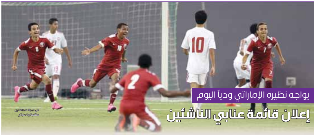
من مباراة ساهية بين قطر والكويت

الاستثمارات في البنية التحتية الرياضية، ستصبح آسيا والصين والشرق الأوسط معاهل كروية قوية في السنوات القادمة لأن هناك استثمارات كبيرة أعتقد أن كل شيء يقومون به يخضع لتخطيط جيد، وأنا على يقين أن لديهم خطط رائعة لتنظيم كأس عالم متميز في 2022، وأضاف المهاجم البرازيلي الذي نوح مع منتخب بلاده بكأس القارات في 2013 على أرضه