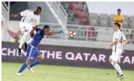
لقطة من لقاء القسم الأول