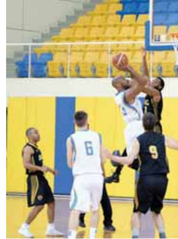
من مباراة الغرافة و قطر

شدد الغرافة مطاردته للجيش متصدراً دوري السلة عقب فوزه أمس على فريق قطر بنتيجة 86/127 في اللقاء الذي جمع بينهما على صالة نادي الغرافة ضمن منافسات الجولة الأخيرة من المرحلة الأولى للمسابقات. وفي المقابل ازدادت وضعيته الخور تعقيداً وتلقى خسارته التاسعة على التوالي عقب خسارته أمس أمام الوكرة بنتيجة 66/94 في لقاء جمع بينهما ضمن منافسات الجولة ذاتها وظل في المركز الأخير للدوري بـ9 نقاط. ورفع الغرافة رصيده إلى 17 نقطة من 8 انتصارات وهزيمة وظل على بعد نقطة واحدة على المتصدر الجيش الذي يجمع في رصيده 18 نقطة من 9 انتصارات. من جهة أخرى ظل فريق قطر في المركز السابع لترتيب الدوري بـ12 نقطة وتلقى هزيمته السادسة منذ انطلاق المسابقة مقابل 3 انتصارات. فيما حقق الوكرة فوزه الثاني في الموسم وظل في المركز الأخير لترتيب الدوري بـ12 نقطة من فوزين و7 هزائم.