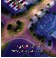
استاد خليفة الدولي أحد ملاعب كأس العالم 2022

يتميز النجم البرازيلي جيفانيلدو فييرا دو سانتوس لاعب فريق شنجهاي الصيني بتسديدات صاروخية وبنية جسدية هائلة، ومنذ ظهوره في الملاعب أطلقت عليه الجماهير لقب هالك نسبة إلى الممثل الشهير لوي فيريجنو الذي لعب دور هالك في فيلم (Incredible Hulk). أما خارج أرض الملعب، فيتميز بالهدوء كما تعلقو الانبساطية وجهه دائماً.