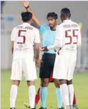
حظة طرد الجابري