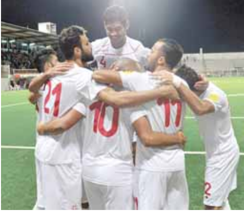
تونس ستفتتح مشوارها بالبطولة أمام السنغال

خبرة حارسه أيمن المثلوثي وصلاية الدفاع في وجود أيمن عبدالنور لاعب بلنسية الإسباني ومهارات وهبي الخزرجي لاعب وسط ستندرلاند الإنجليزي كأبرز نجوم الفريق الحالي.