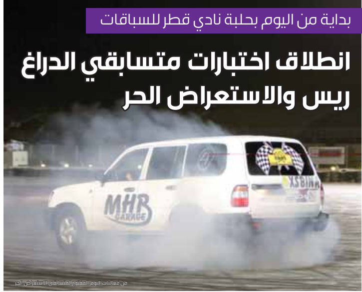
من فعاليات اليوم المفتوح لمشاهدة المتسابقين في الر

وسينضم المهندي اليوم الإعلان عن القائمة النهائية للمشاركين في الرالي، وسينضم توزيع كتب الطريق (الرد بوك) وسينضم تدقيق المستندات وتوزيع الإرقام، كما سينضم الفحص الفني للسيارات المشاركة وذلك بموقع مقر النادي بالشارقة. وينطلق الرالي غداً من منطقة (الزيد) الساعة التاسعة والنصف صباحاً بحسب كتاب مسارات الرالي وسينتهي الرالي في الرابعة والنصف عصراً ويقع توزيع الجوائز على الفائزين. ومن جانبها قررت اللجنة المنظمة للريالي تقديم مساعدات للمشاركين من خارج دولة الإمارات بريمة المتحدة من ضمنها توفير الإقامة للسائقة وملاحه وإلقاء الرسوم المشاركة، والمساعدة في الحصول على تأشيرة دخول الإمارات. وتكون بطولة الإمارات للرياليات التي تنظم من قبل نادي الإمارات للرياليات، من خمس جولات هي: رالي الشارقة ورالي أم القيوين في 24 فبراير ورالي رأس الخيمة في 24 مارس ورالي الشارقة في 27 أكتوبر ورالي الشارقة في 1 ديسمبر. ومن جانبه أعرب البطل القطري خالد المهندي عن سعادته الفاعية بالمشاركة في رالي الشارقة الجولة الأولى من بطولة الإمارات للرياليات، وخسب المهندي عن أنه لأول مرة يشارك في الرالي وأنه في قمة جاهزيته قائلاً: «أنا في قمة جاهزيته ومعدوني مرتفعة وأعتره تحدياً جديداً ولتعمري السعادة بوجود أشقائي من الإمارات ودول الخليج، وهدي من المشاركة هو التواجد القطري في مثل هذه التظاهرات والأحداث الرياضية، وتوطيد عقد الصداقة والتعاون بين الشباب، والمساهمة في إنجاح الرالي، والمنافسة من أجل صعود منصة التتويج ورفع راية قطر عالية خفافاً».