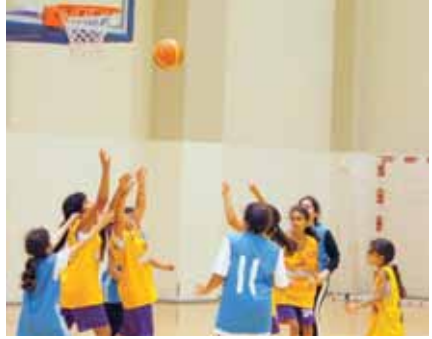
من مباريات دوري السلة للبراعم والناشئات

الدوحة رباب شرف الدين تستأنف مساء اليوم مباريات الدوري القطري لكرة السلة للبراعم تحت 14 سنة والناشئات تحت 18 سنة للموسم الحالي 2016/2017 التي تنظمه لجنة رياضة المرأة القطرية، وتقام المباريات بالمصالة الرياضية بمنطقة أسباير زون ويستمر لمدة 10 فرق وتستمر منافسات البطولة يوم 23 من شهر فبراير 2017. وتشارك في الدوري فرق قطر وبي بي إس سكيت بول والمدارس الأمريكية، وكيو بي هويس وفام باسكت ضمن فئة البراعم، وبي هويس وبي إس سكيت بول والمدارس الأمريكية، وكيو هويس وفام باسكت بول والمدارس الهندية دبي بي إس ضمن فئة الناشئين. وتستأنف المنافسات بمباريات تقام المباراة الأولى ضمن منافسات البراعم تحت 14 سنة وتجمع فريق «فام» مع «كيو بي هويس»، أما المباراة الثانية فتجري