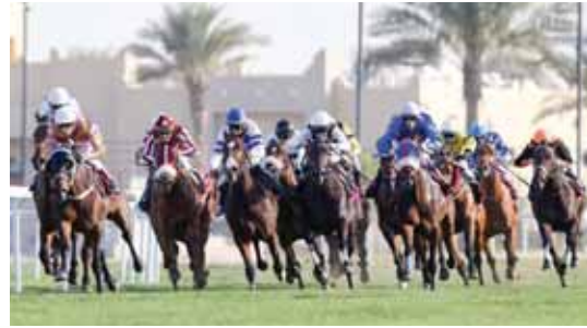
تنامس متير على كؤوس وجائزة سمو الشيخ عبدالله بن خليفة اليوم

يخصم نادي السباق والفروسية مسابقة خاصة للجماهير لترشيح الخيل الشابة في جميع الأشواط التسعة وسيتم السحب مباشرة عقب انتهاء سباقات اليوم على عدد كبير من الجوائز العينية، وذلك بتخصيص كؤوبن بالصحف المحلية، أو من نادي الفروسية أمام الجماهير لتضع ترشيحاتها من خلاله ومن ثم وضعه في الصندوق المخصص لذلك لإجراء عملية السحب مباشرة.