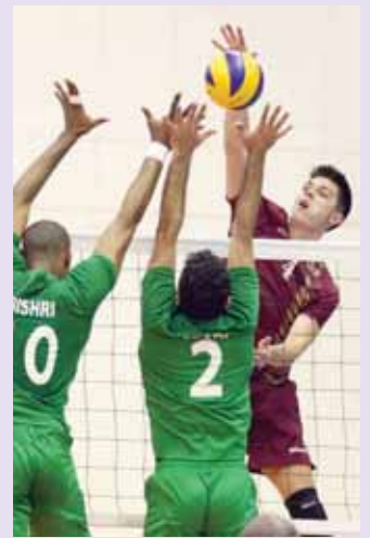
من مباراة الجيش والأهلي

جاءت المباراة جيدة المستوى وكان الجيش الأفضل خاصة في الشوطين الثاني والرابع اللذين شهدا انهياراً أعلامياً غير متوقع.