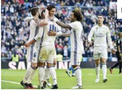
الريال يواجه إشبيلية الليلة في إياب ثمن نهائي كأس إسبانيا