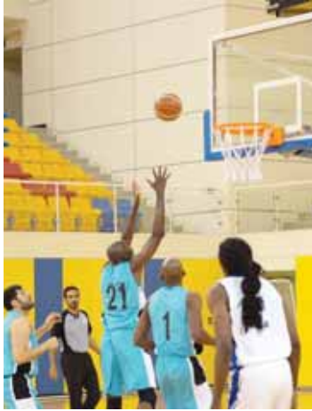
من مواجهة الوكرة و قطر

وفرض الغرافة سيطرة مطلقة على مجريات لغائه مع قطر وتفوق عليه في الفترات الأربع للمباراة مستفيداً من جاهزية لاعبيه العالية وتفوقه الفني والبشري على منافسه. وتقدم الغرافة على منافسه بما 12/31 في الفترة الأولى و67/95 في الثانية و86/127 في الثالثة وقدم الغرافة خلال مواجهته مع قطر واحدة من أقوى عروضه منذ انطلاق الدوري وتخطى عقبة الـ100 نقطة مسجلاً واحدة من أروع النتائج في دوري الموسم الحالي.